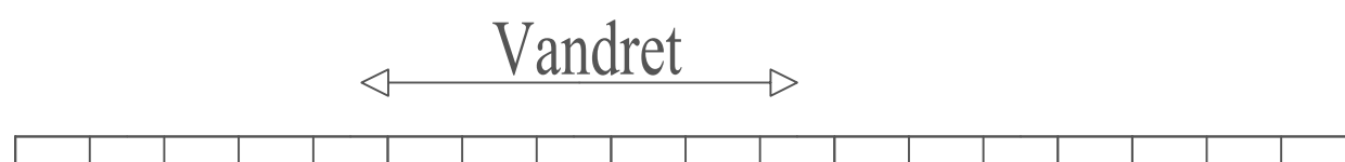
SNIT A - A